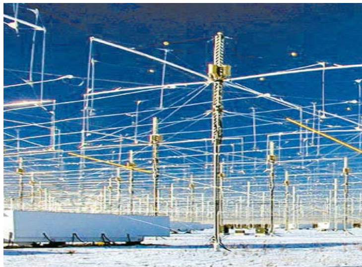
Figura 1: Instalações do projeto H.A.A.R.P. no Alasca. (Folha Universal, 2011)

Os investimentos em estudos com o HAARP se intensificaram após os ataques do 11 de Setembro em 2001, desde este período o mundo enfrenta a chamada década do “combate ao terror”. Tal combate foi iniciado pelo governo de George W. Bush, quando declarou guerra ao Afeganistão, ao Iraque, aos extremistas terroristas ligadas à rede Al Qaeda juntamente com seus aliados e aos países que abrigam tais grupos.