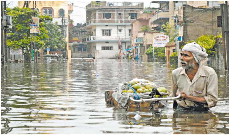
Figura 5: Também na Índia. Homem caminha em meio à enchente. Manipulação do tempo possibilitaria provocar chuvas em excesso. (Folha Universal, 2011).