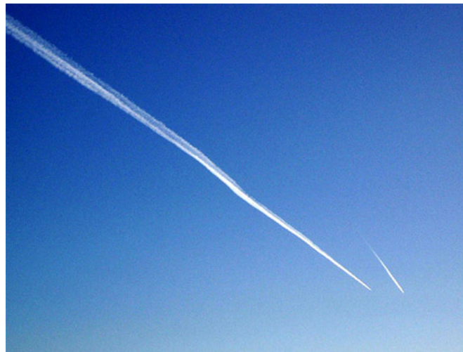
Figura 7: Rastros químicos dispersos na atmosfera (Lagoativa, 2011).

Estas grandes nuvens químicas dispersadas em altitudes elevadas são feitas para que preencham as falhas ou bolhas ionosféricas da atmosfera para evitarem a perda de sinal das comunicações e perdas de equipamentos que custam centenas de milhares de dólares (Ecocídio, 2010).