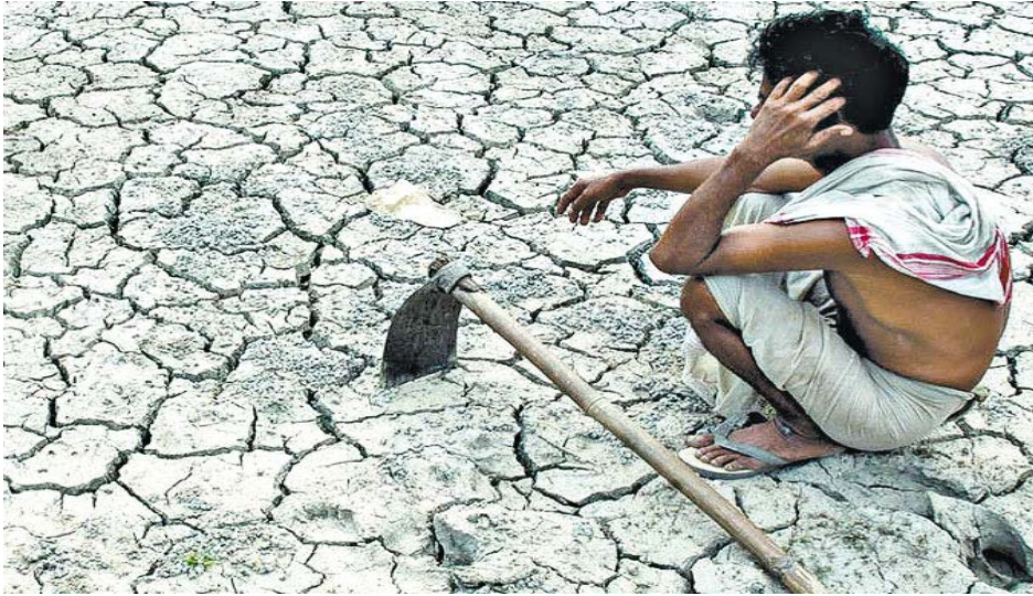
Figura 4: Agricultor em região atingida por forte seca na Índia. Arma norte-americana já pode reproduzir artificialmente esta situação (Folha Universal, 2011).

Para o engenheiro elétrico norte-americano Brooks Agnew, especialista em ondas de baixa frequência, como as do HAARP, é de conhecimento geral que o projeto pode modificar zonas de pressão, com a manipulação da ionosfera, e, assim, controlar as chuvas de um determinado local.